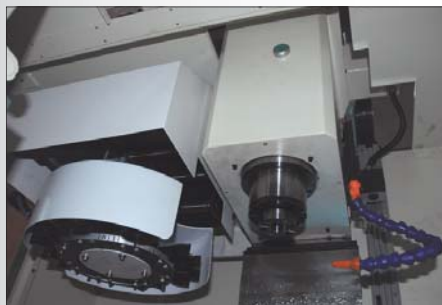
8-позиционный инструментальный магазин с механизмом смены инструмента